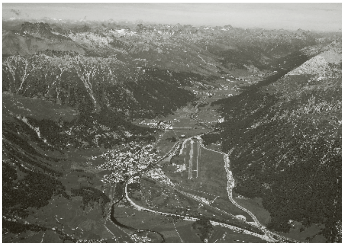
Nevarnosti poplav ni več: Novo strugo reke Flaz so speljali po robu doline, ki je od Samedana oddaljen štiri kilometre. Zdaj se Flaz šele za letališčem in občino steka v reko Inn. Pred posegom se je v Inn iztekal pred Samedanom.

če preglasno razmišljajo o novostih. Toda te platforme so kot laboratoriji, v katerih lahko akterji svobodno razmišljajo o poizkusih. Rezultate bi nato lahko vrnili v običajne upravne procese in politične strukture,« razloži Pfefferkorn.